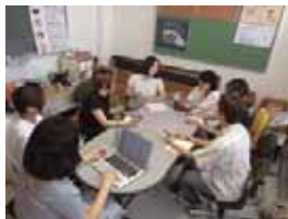
杉並キャンパス 女子美祭実行委員

今年の女子美祭は私たち女子美生にとっても、女子美祭を訪れる人にとっても、様々な捉え方のある女子美祭にしたいという意味を含め、人によって表現の仕方が変わる擬音語・擬声語の意味を持つ『オノマトペ』をテーマとしました。