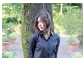
相模原キャンパス 女子美祭実行委員

今年度もニケ会の皆様より温かいご支援をいただきましたこと、厚く御礼申し上げます。今年度女子美祭テーマ「てんやわんや」に沿い賑やかで楽しい女子美祭になるようたくさんの展示や企画や催しものがございます。是非、女子美祭に遊びに来てご覧になってください。