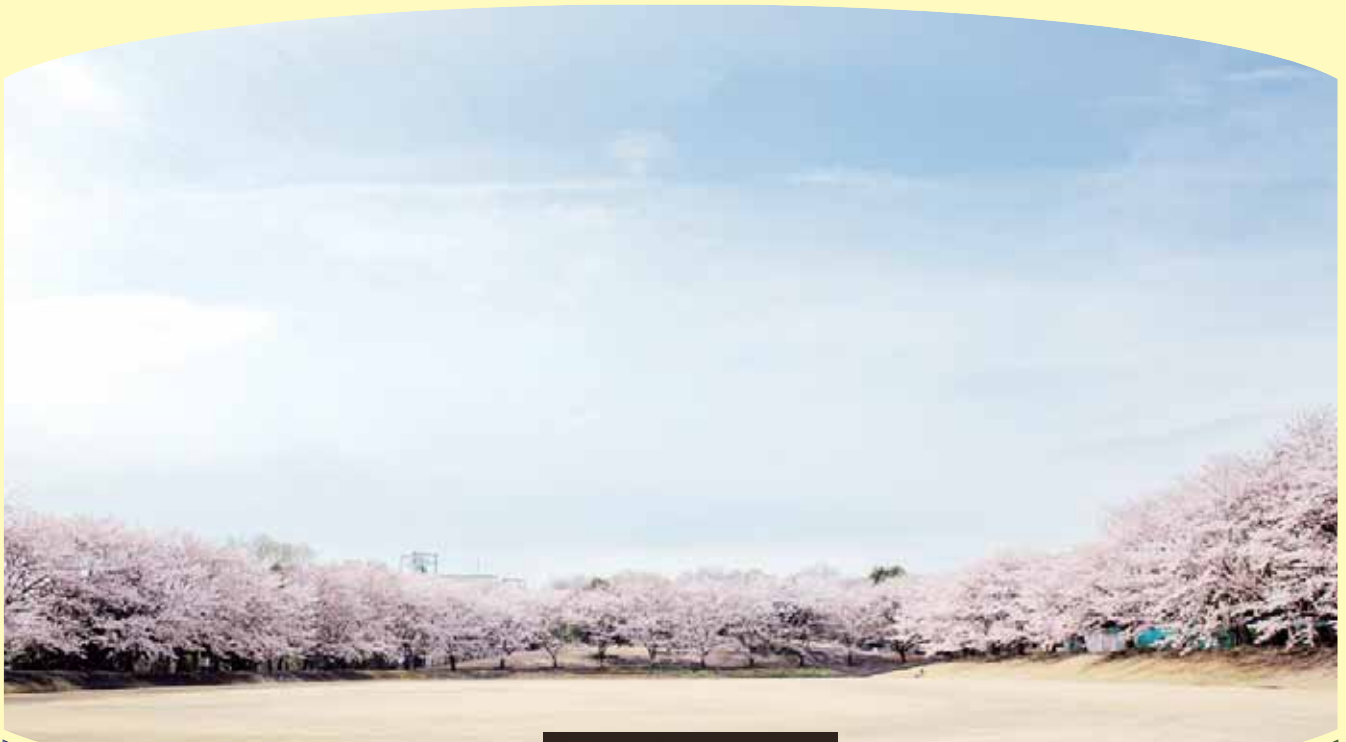
相模原キャンパス グラウンド