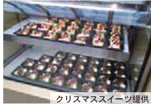
クリスマススイーツ提供