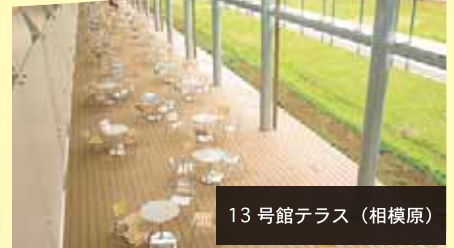
13号館テラス (相模原)