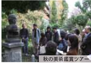
秋の美術鑑賞ツアー