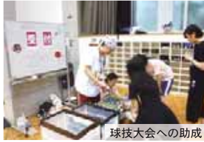
球技大会への助成