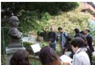
東京大学薬学部棟

【所在地】文京区本郷7-3-1 【交通】都営大江戸線「本郷三丁目」駅より徒歩6分