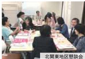
北関東地区懇談会